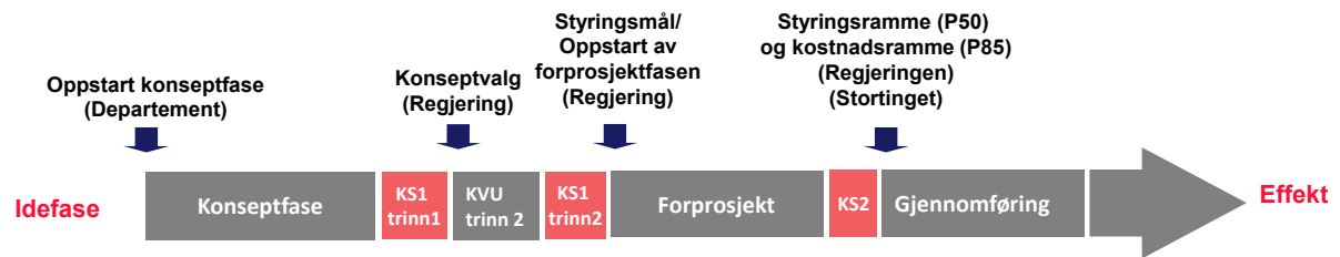
Figur 4.2 Statens prosjektmodell ved KVVU og KS1 i to trinn

I saker som omhandler arealinngrep, vil planlegging skje i hht. plan- og bygningsloven, med lovmessige krav til høring mv. Prosessene etter plan- og bygningsloven gjelder uavhengig av dette rundskrivet. I arbeidet med prosjektets fremdriftsplan bør det vurderes hvordan prosessen kan legges opp for å bidra til en effektiv gjennomføring. Normalt vil reguleringsarbeidet inngå som en del av forprosjektfasen i prosjektet. I samferdselsprosjekter vil arbeidet med forprosjektfasen være delt opp i ulike deler, normalt kommunedelplan og reguleringsplan, og strekke seg over lengre tid enn i mange andre prosjekter.