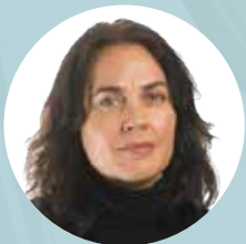
Frøy Gudbrandsen, VG