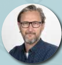
Lars West Johnsen, Dagsavisen